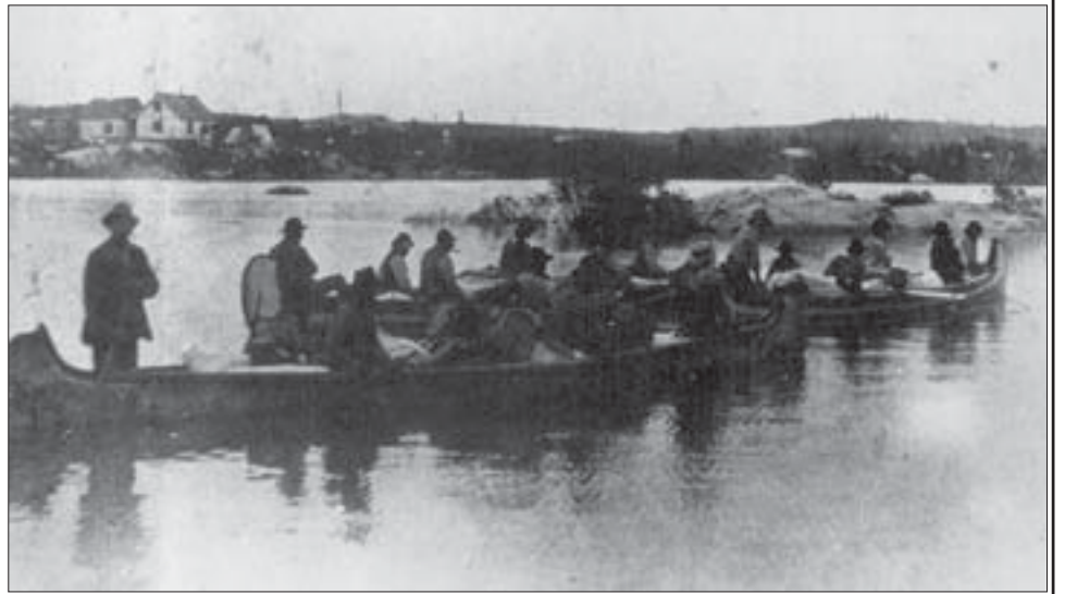
Un groupe d'Indiens, accompagné de quelques voyageurs, a fait le trajet entre Moose Factory et le poste de traite de New Brunswick House sur la rivière Missinaïbi au printemps. Un deuxième groupe s'est rendu au poste de Frederick House.