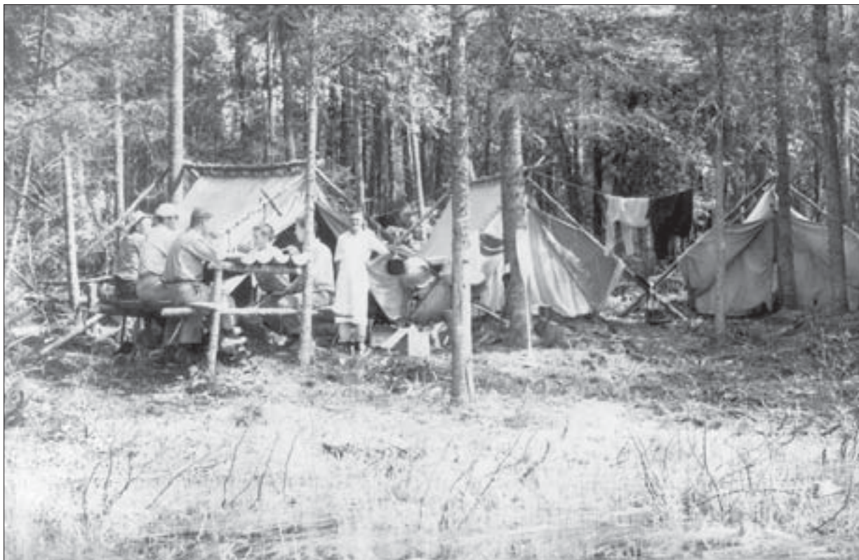
Une équipe d'arpenteurs et de représentants du gouvernement ontarien ont monté leur campement dans la région de la rivière Abitibi, au nord du 48e parallèle au courant de l'été. On estime que la région contient un potentiel hydro-électrique très important, en plus d'immenses ressources forestières et des gisements à découvrir qui pourraient contribuer à remplir les coffres de la province.