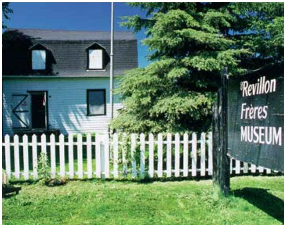
Un entrepôt de la société Révillon Frères, situé à l'embouchure de la rivière Moose. L'entreprise occupe l'emplacement depuis 1903.

Il s'agit donc d'un nouveau compétiteur pour la Compagnie de la Baie d'Hudson qui profitait pourtant d'un quasi-monopole du commerce des pelleteries depuis sa fusion avec la Compagnie du Nord-Ouest en 1821.