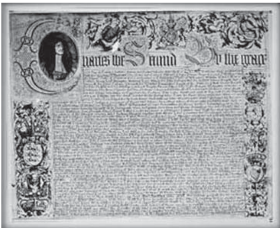
La Gazette a obtenu copie de la charte royale attribuée à la Compagnie des aventuriers en 1670.

Nous espérons que vous trouverez la lecture de ce petit journal à la fois intéressante et divertissante. Comme vous l'avez sûrement constaté, cette publication cherche à reconstituer des événements historiques de grande importance pour la région que vous visitez en faisant « parler » les personnages qui y ont pris part. Bien que les faits et les dates soient en grande partie très précis, nous avons parfois utilisé un peu de latitude en cherchant à rendre le journal aussi divertissant que possible. Nous avons également tenté de présenter notre journal — tantôt La Gazette, tantôt l'Express — en utilisant une mise en page qui reflète les modes et les styles de l'époque. Bonne lecture !