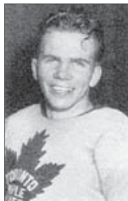
Bill Barilko porté disparu...

Introuvable, certains ont avancé que Barilko s'était enfui en Union soviétique, d'où ses parents sont originaires. Ils avancent qu'il occuperait un poste d'entraîneur de hockey dans ce pays.