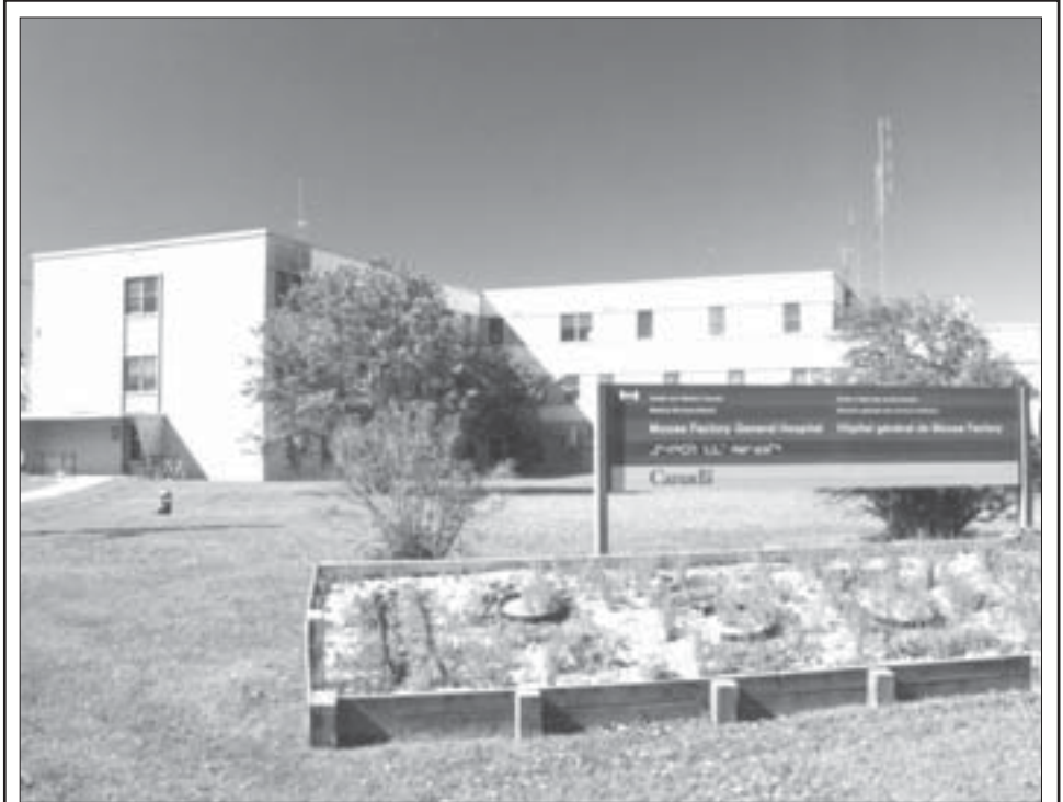
L'Hôpital de l'île de Moose Factory fut construit en 1949 et a accueilli des centaines de tuberculeux dès l'année suivante.

Il s'agit d'un ingénieux système de chauffage central qui fonctionne au charbon. Les tuyaux ont été aménagés au dessus des rues de la communauté puisqu'il aurait été trop périlleux de les enfouir sous la terre en raison du gel.