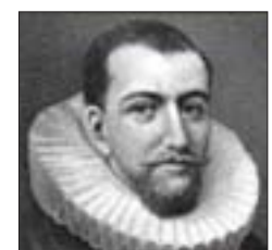
Henry Hudson Perdu en mer

aux rigueurs de l'hiver dans cette région glaciaire, dans le coin sud-est de la baie. Le capitaine avait refusé des vivres au départ en Angleterre par souci de ne pas trop charger le Discovery