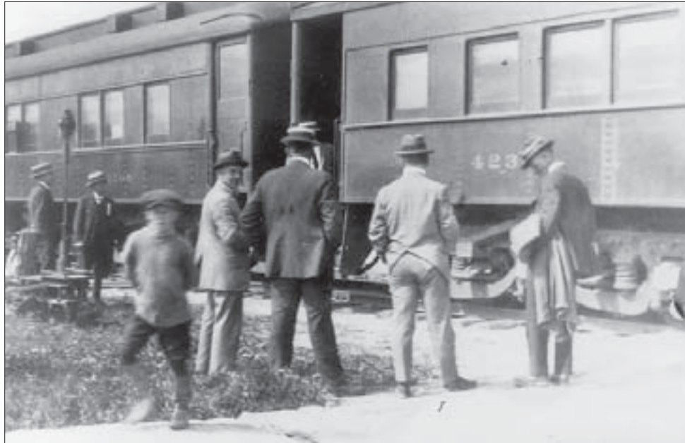
Les résidents de Cochrane font comme s'ils y étaient habitués, mais le train ne passe dans la région que depuis deux semaines. Le Transcontinental, qui passe par Québec en route vers le nord de l'Ontario et l'Ouest, a déjà créé de nombreux emplois.

Ce dernier avait « tout fait en grand, pour accommoder une grande population », avait-il affirmé. Il prévoyait que les 3e, 4e, 5e et 6e avenues, larges de 35 mètres chacune, constitueraient les principales artères de la ville. Il a également tracé des rues à l'est du lac Commando pour les vagues futures de développement.