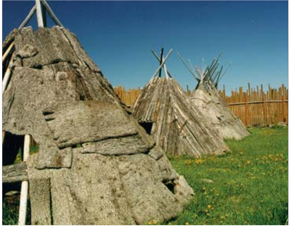
Les Cris utilisent tantôt le wigwam, le migwam ou encore le teepee, que l'on voit ici.

«Notre région est comme un jardin, parce que plusieurs choses poussent ici et les indiens figurent parmi les choses qui poussent. Les animaux ont été donnés aux indiens pour qu'ils puissent nourrir leurs enfants et se nourrir eux-mêmes, et nous avons toujours partagé les richesses de ce jardin», concluait-il.