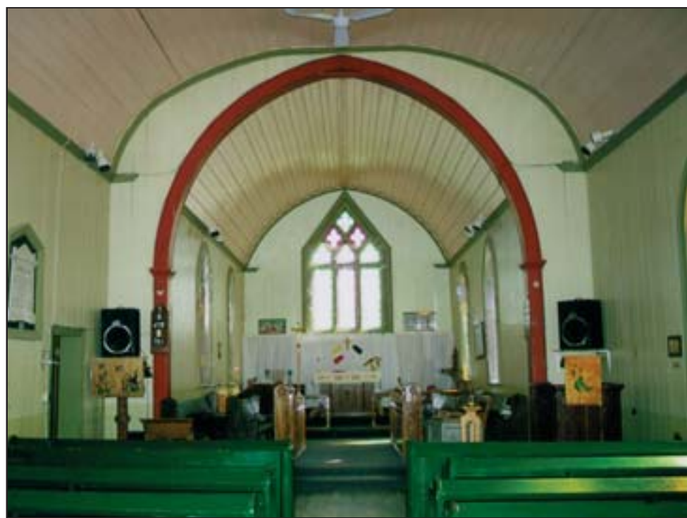
L'église anglicane de Moose Factory vient tout juste d'être repeinte. Pendant la construction, l'édifice était parti à la dérive avec les glaces flottant vers le nord, mais on a réussi à la ramener à bon port. On a retrouvé l'édifice — incroyablement en une seule pièce — à plusieurs kilomètres d'où on a dû le remorquer jusqu'à emplacement permanent sur l'île. On a décidé de tout simplement percer des trous dans le plancher de l'église pour laisser pénétrer l'eau si jamais les inondations menaçaient à nouveau la petite communauté insulaire.

« Nous avons un tellement grand besoin de bois que j'ai fait demande à la maison-mère pour que l'an prochain, à bord de notre vaisseau de provisions, nous obtenions les services de deux employés qui auront comme seule tâche de nous trouver des billots et de les transporter jusqu'au moulin à scie », ajoutait Undergarten.