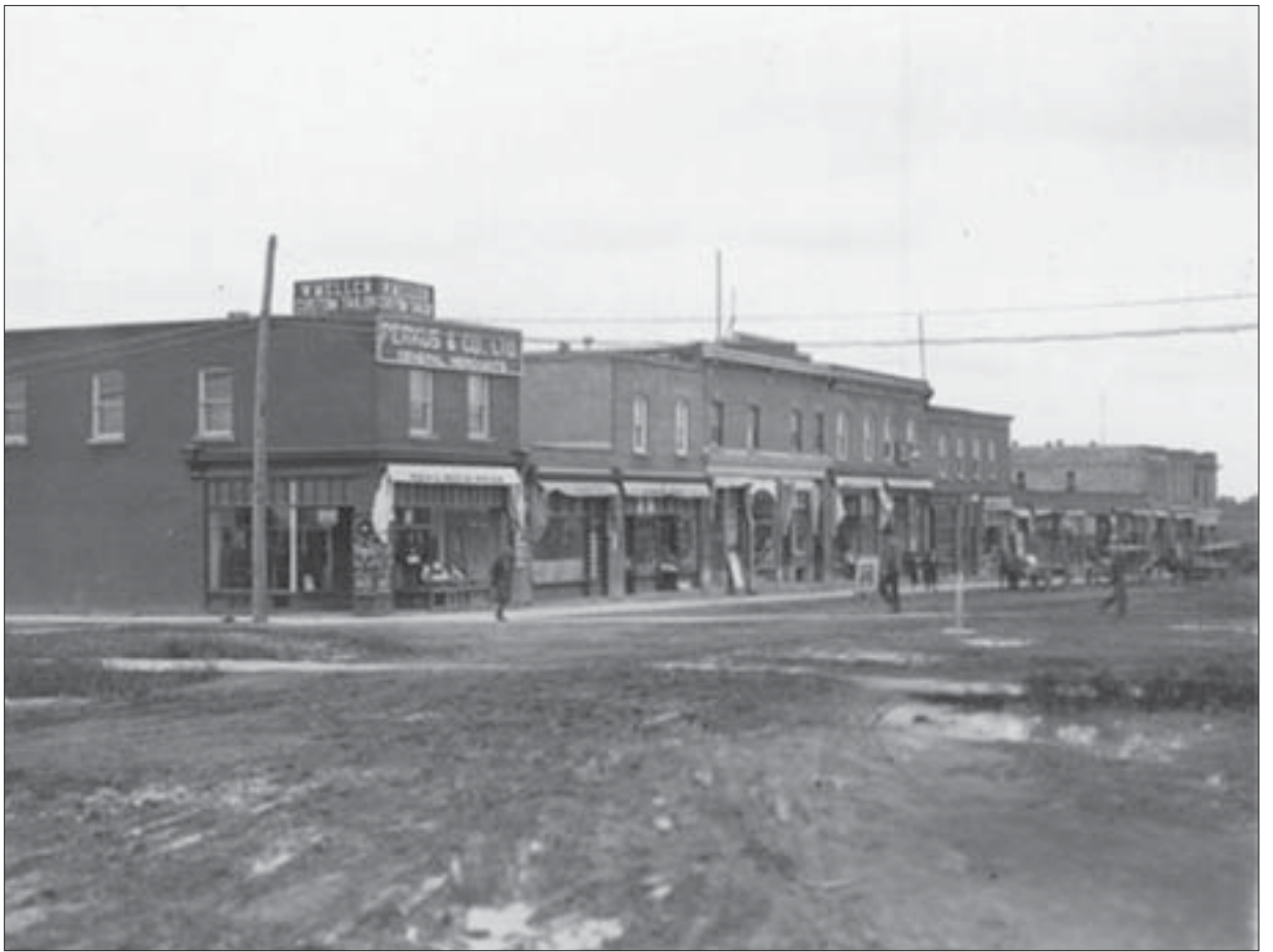
La vie n'a pas été facile pour les résidents de Cochrane qui ont subi les désastreux effets de deux incendies majeurs en un peu plus de cinq ans. Plusieurs colons y ont trouvé la mort, n'ayant pu se réfugier assez rapidement dans un endroit sécuritaire. Bon nombre d'anciens résidents ont quitté après avoir tout perdu dans les deux incendies. D'autres, comme en témoigne cette photo prise à l'été 1925, n'ont pas hésité à y reconstruire leur commerce ou leur domicile.

* Avec des citations tirées de M. Begley, Cochrane qui cite le journal Northland Post.